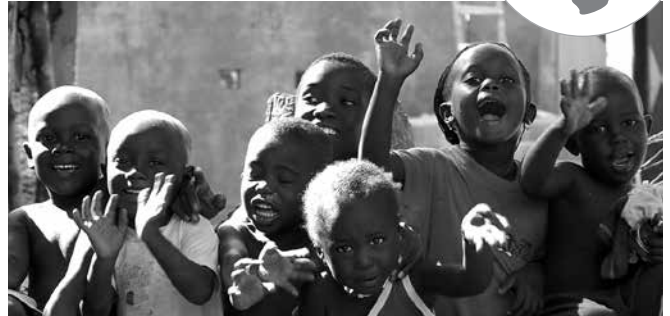
Tanquem cicle a Kolda amb un balanç positiu de l'impacte generat en la salut ocular

L'any 2008 la FFS va signar un acord de 5 anys dins del marc estratègic del Ministeri de Salut de Senegal per la disminució de la prevalença de la ceguesa en una de les regions rurals i més empobrides del país, la Regió de Kolda. De forma sostenible i autosuficient es van iniciar un conjunt d'actuacions integrades i transversals, dirigides a la normalització de la salut ocular de Kolda. Aquest 2013/14, després de 5 anys de presència continuada en el terreny, s'arriba a la fi del projecte. El balanç de l'evolució i els resultats són positius. S'han assolit fites importants que han generat un impacte real en la millora de la salut oftalmològica de la Regió.